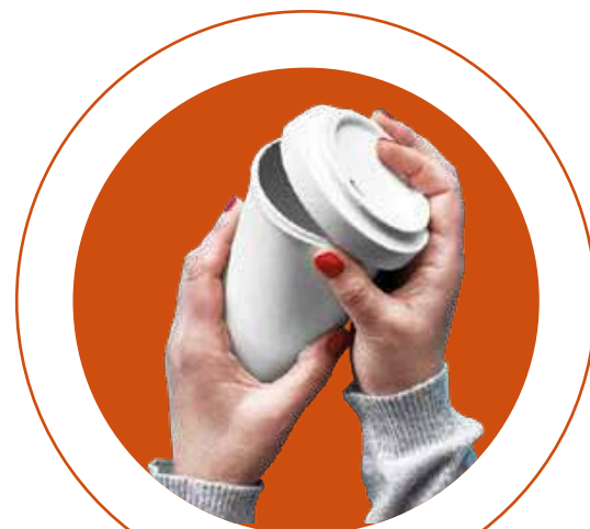
TAMPA VENDIDA SEPARADAMENTE

Para servir, transportar, reunir-se, trabalhar ou relaxar. Contém película interna de proteção, formando uma barreira aquosa evitando vazamentos de líquidos.