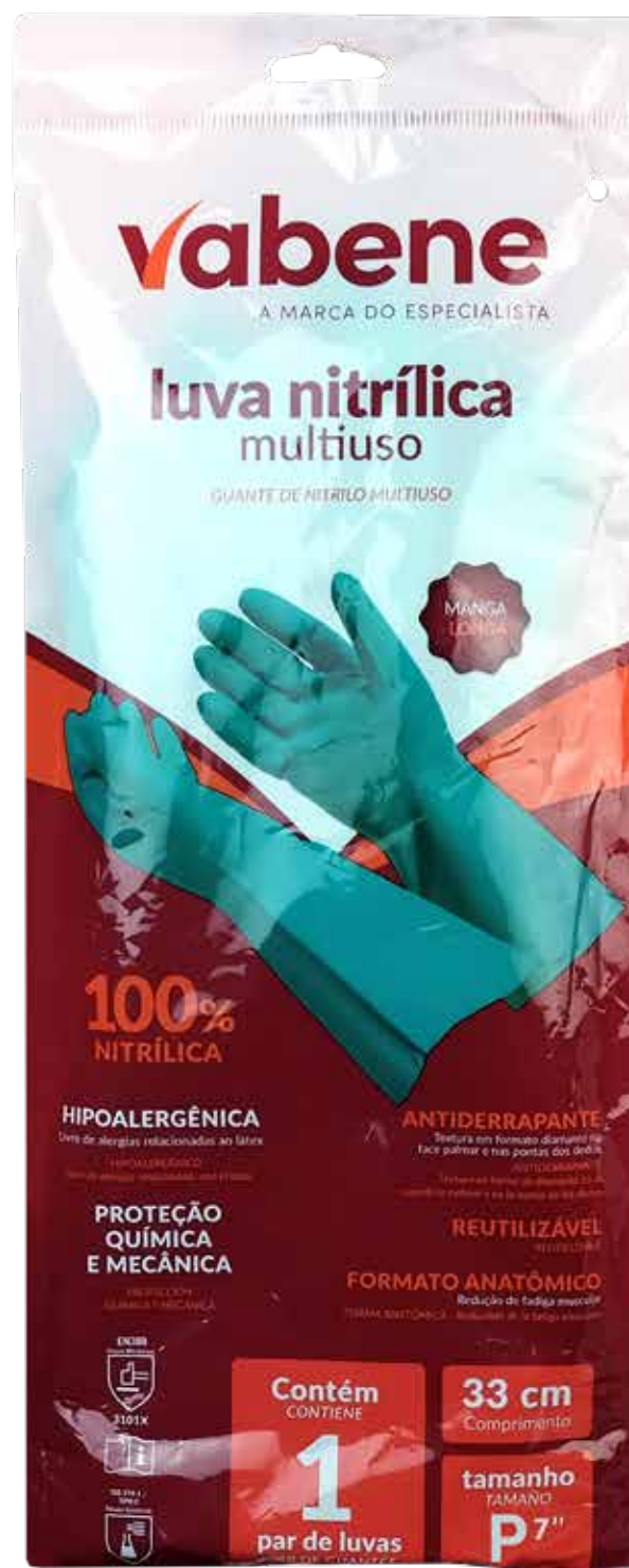
P - 1736