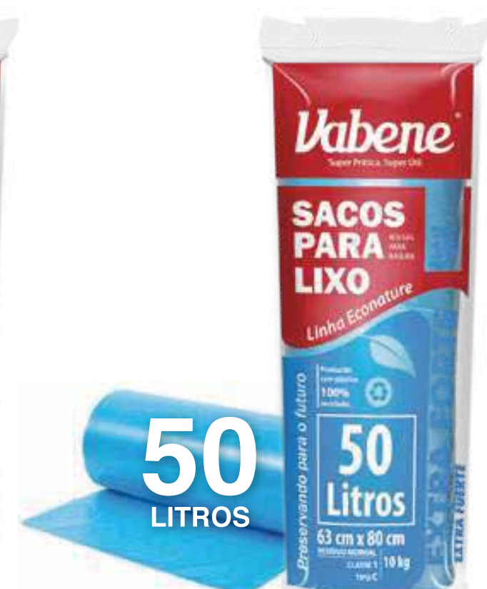
Saco de Lixo 50 Litros Varejo ■ 2272

Rolo Medida: 59 cm X 62 cm Quantidade: 25 sacos Fardo: 25 rolos