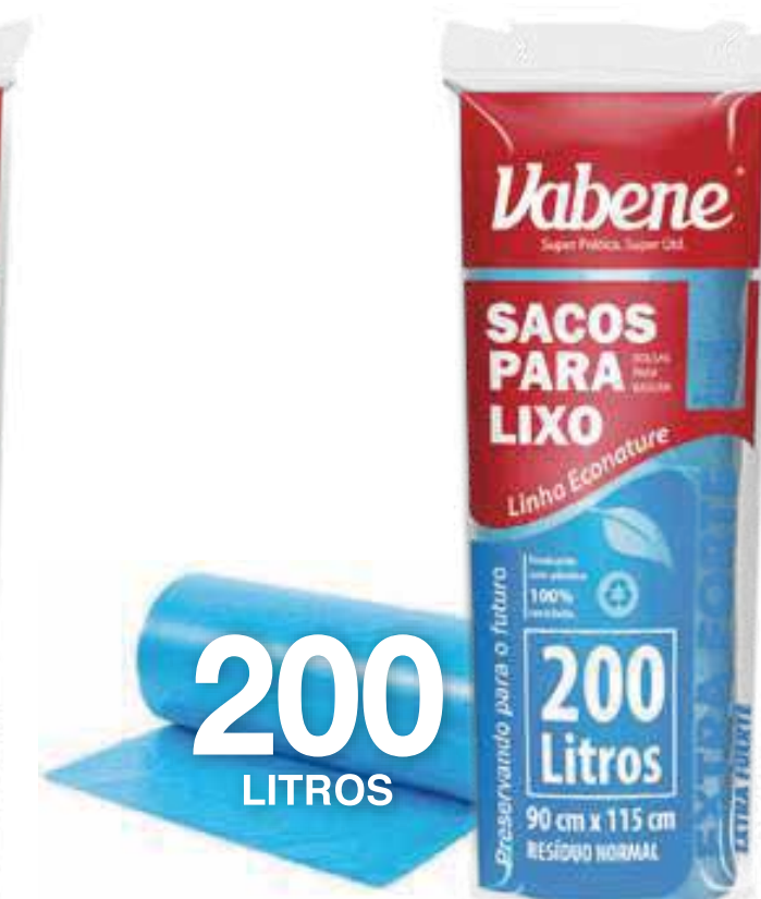
Saco de Lixo 200 Litros Varejo ■ 2274

Rolo Medida: 75 cm X 105 cm Quantidade: 10 sacos Fardo: 25 rolos