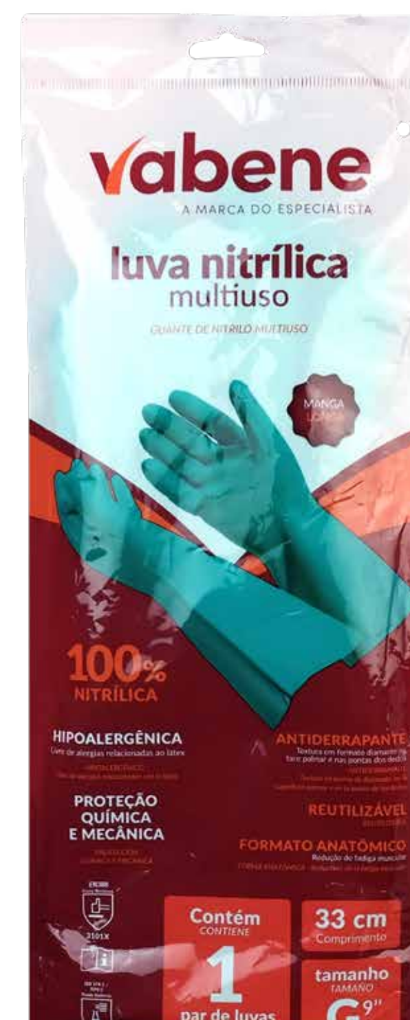
P - 1738