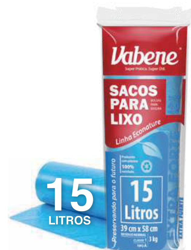
Saco de Lixo 15 Litros Varejo ■ 2270

Rolo Medida: 39 cm X 58 cm Quantidade: 40 sacos Fardo: 25 rolos