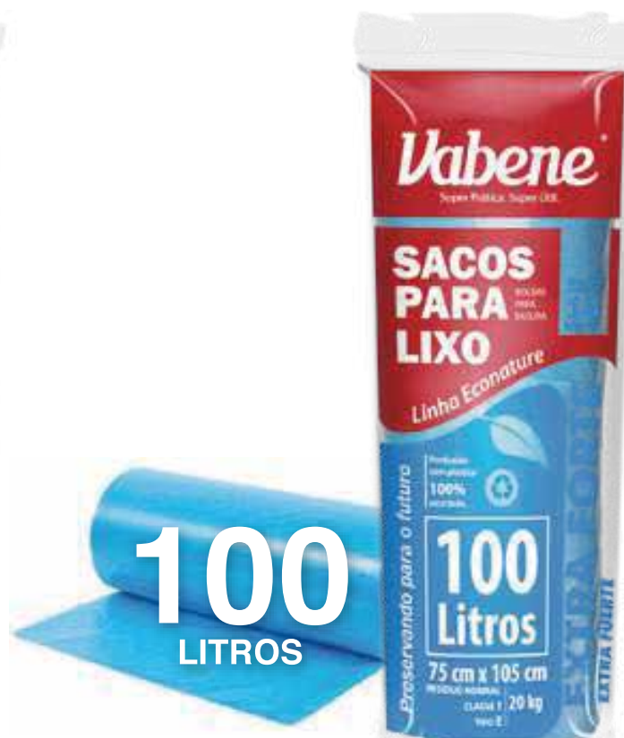
Saco de Lixo 100 Litros Varejo ■ 2273

Rolo Medida: 63 cm X 80 cm Quantidade: 15 sacos Fardo: 25 rolos