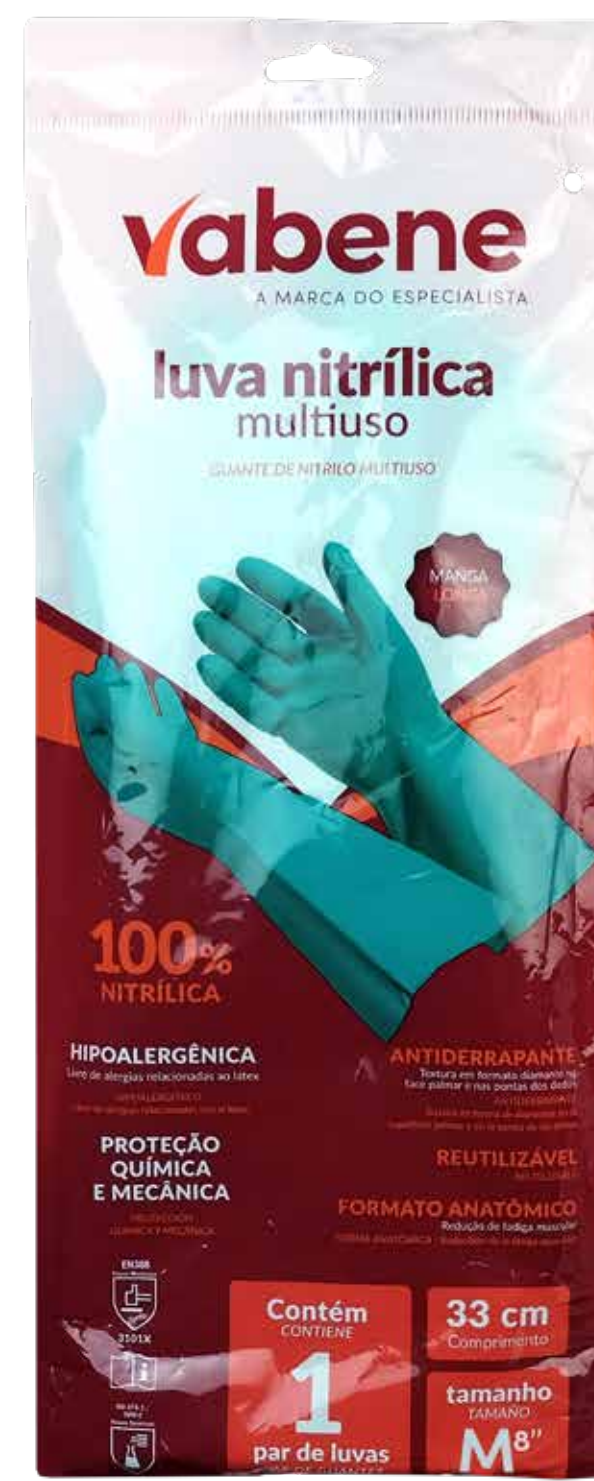
P - 1737