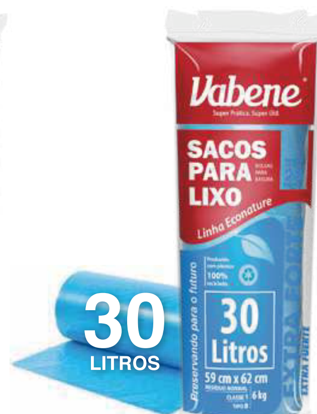
Saco de Lixo 30 Litros Varejo ■ 2271

Rolo Medida: 39 cm X 58 cm Quantidade: 40 sacos Fardo: 25 rolos