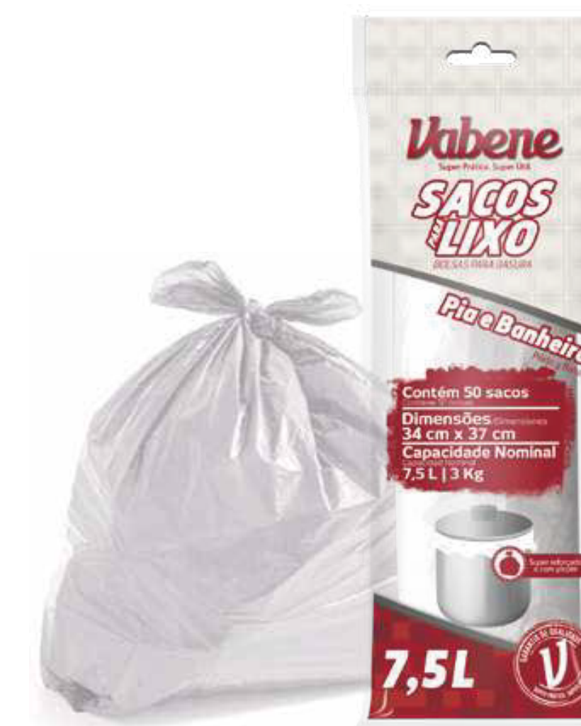
Saco de Lixo 7,5 Litros Varejo □ 1170

Rolo Medida: 90cm X 115 cm Quantidade: 5 sacos Fardo: 25 rolos